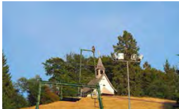
Greifvogel mit Kirchturm im Hintergrund, Todtnauberg, Kapellenlift, Südschwarzwald