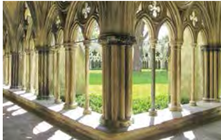
Kreuzgang, Cathedral of Salisbury, 3673+X3 Salisbury, UK

Vom Trubel der Kathedrale in die Ruhe des angrenzenden Kreuzgangs